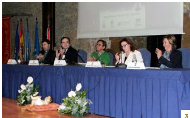
3. La mesa presidencial en el acto inaugural.

La inauguración del mercadillo estaba programada para las cuatro y media, pero... En el vestíbulo del Auditorio estaban ya los artesanos, terminando de colocar sus puestos y, claro, no pudimos pasar de largo, así que ya quedó inaugurado por la mañana.