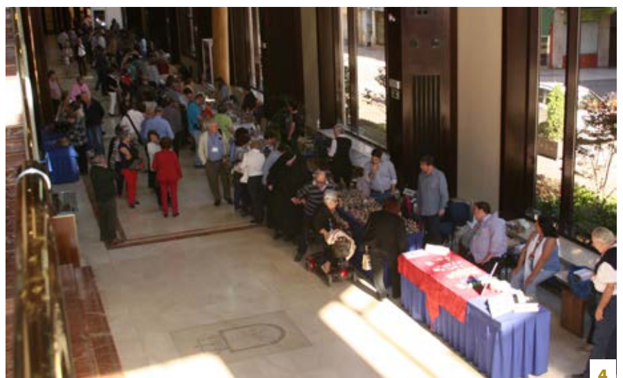
4. En el "mercadillo" de los artesanos belenistas.