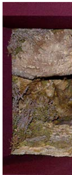
32. Detalle del anuncio a los pastores de José Espiña. Avilés.