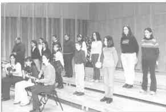
Coro Parroquial de San Julián de los Prados