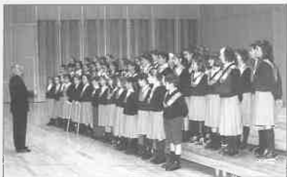
Coro Colegio de La Inmaculada