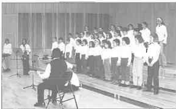
Coro Gesta I.