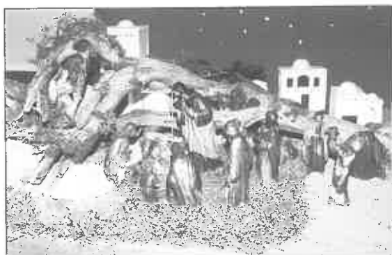
Tercer Premio: Centro Social del Naranco