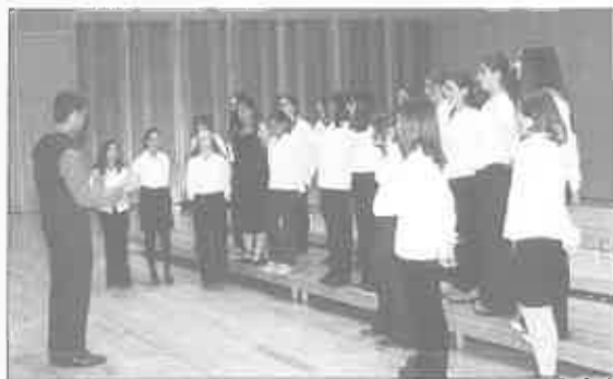
Aula Coral de IES "La Ería"