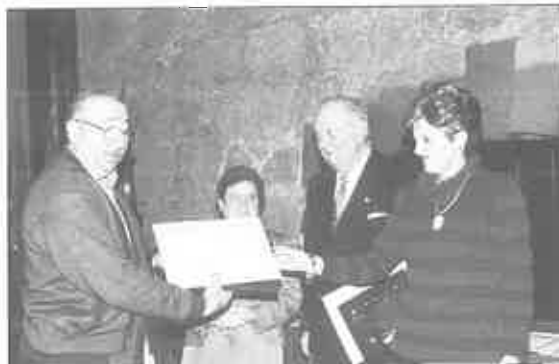
Segundo Premio: San Juan Bautista de la Corredoria