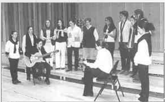
Grupo Club Cines