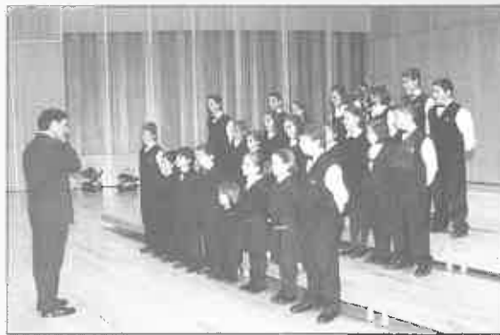
Coro Primaria Dominicas