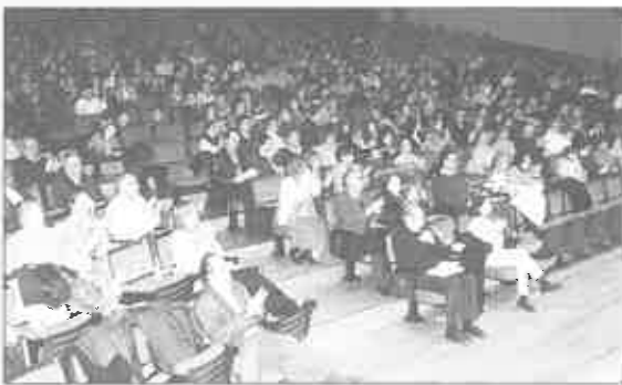
Sala Principal del Auditorio, en el X Certamen de villancicos