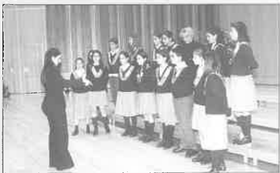
Coro Juvenil Colegio de La Inmaculada