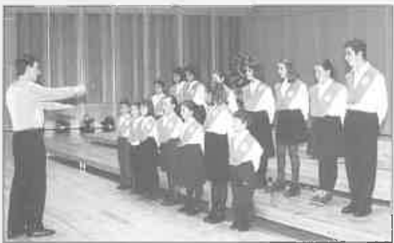
Coro Alevín "Escuela de Música y Divertimento"