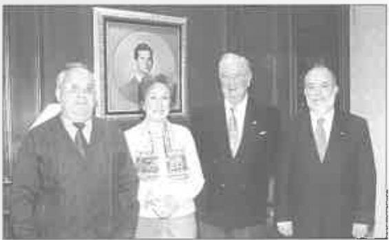
Componentes del Jurado con el Presidente de la Asociación Belenista