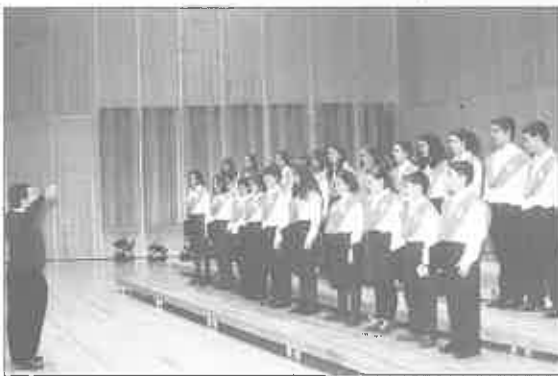
Coro Infantil "Escuela de Música Divertimento"