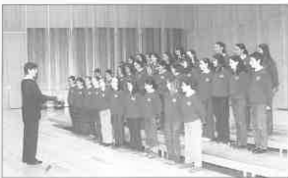
Coro de Santa María del Naranco