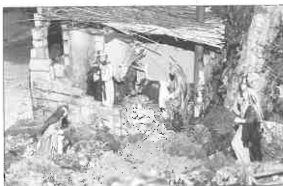
Primer Premio: Centro Social de la Corredoria