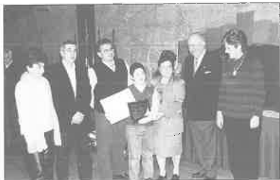
Primer Premio: San Melchor de Quirós