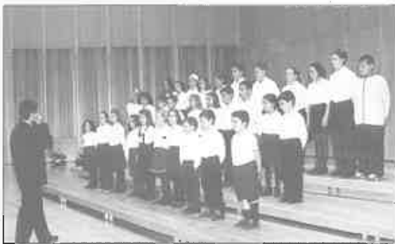
Aula coral Municipal Dolores Medio