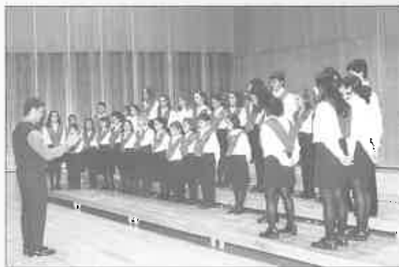
Escolinos del Orfeón de Castrillón