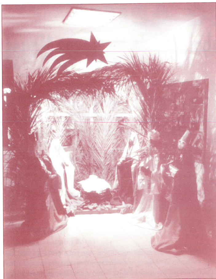
BELEN DEL COLEGIO URSULINAS

E l pasado día 22 de noviembre, y en el salón de actos de la Parroquia de Nuestra Sra. del Carmen, en la calle Santa Susana, de Oviedo, se celebró la asamblea extraordinaria de la Asociación Belenista de Oviedo, en la que, entre otros asuntos, se tomó el acuerdo, por unanimidad, de ofrecer las siguientes distinciones: