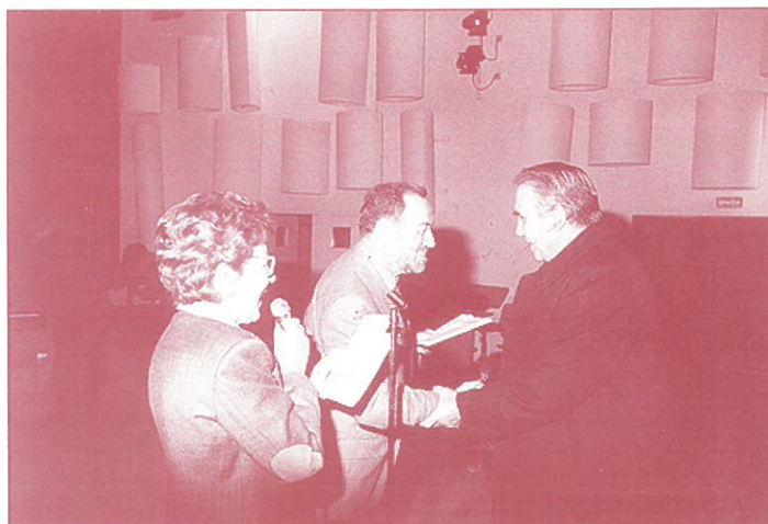
ENTREGA DEL 3.º PREMIO A LA PARROQUIA DE COLLOTO