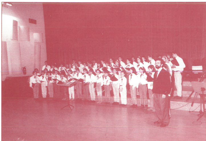
CORO DEL COLEGIO GESTA II. 1.º PREMIO VILLANCICOS