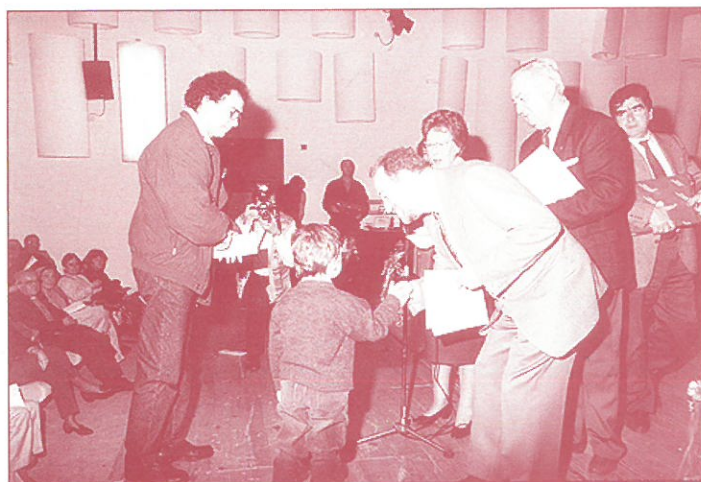
ENTREGA DEL 1.º PREMIO A STA. MARIA LA REAL DE LA CORTE