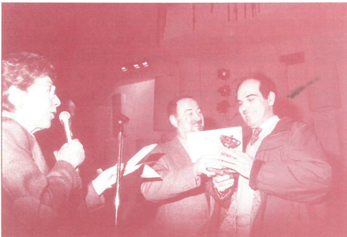
ENTREGA DEL 1.º PREMIO AL COLEGIO NACIONAL DE FOZANELDI