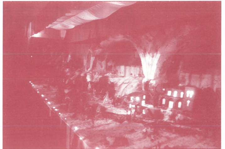
BELEN DEL CONVENTO DE SANTO DOMINGO

Me rogáis, amigos, que yo, precisamente yo, os hable de belenes, vamos, de lo que no sé. Pude acudir a mis libros, documentándome. No he querido, porque, entonces, no sería mi corazón quien hablase. Así que como no quiero decepcionar a nadie y menos a los niños, que a lo mejor sus padres les dan a leer estas breves palabras que brotan del alma de un hombre, principalmente para los críos, si éstos me lo permiten, me gustaría retrotraerme a mi niñez, a mis raíces en nues-