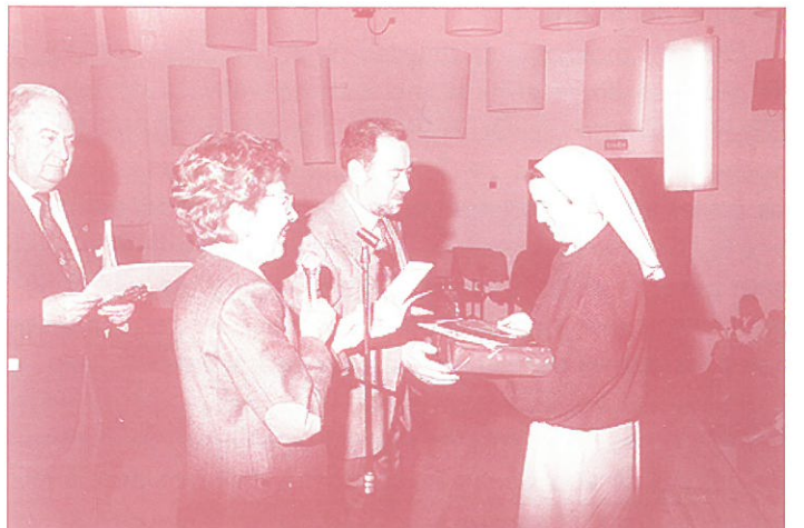
ENTREGA DEL 3.º PREMIO AL COLEGIO SANTA TERESA DEL NARANCO