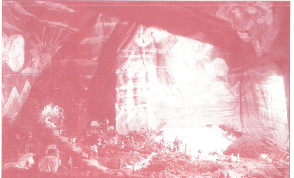
BELEN DEL COLEGIO NACIONAL DE FOZANELDI 1.º PREMIO BELENES

En cuanto a colegios participaron 11: Colegio Gesta n.º 1, Colegio Gesta n.º 2, Colegio Nacional Parque Infantil, Colegio Peñaubiña, Colegio de Fozaneldi, Colegio P. de la calle La Luna, Colegio San Ignacio de Las Segadas; Colegio Santa Teresa, Colegio Sta. M.ª del Naranco (Ursulinas), Colegio Palacio de Granda y Colegio Inmaculada.