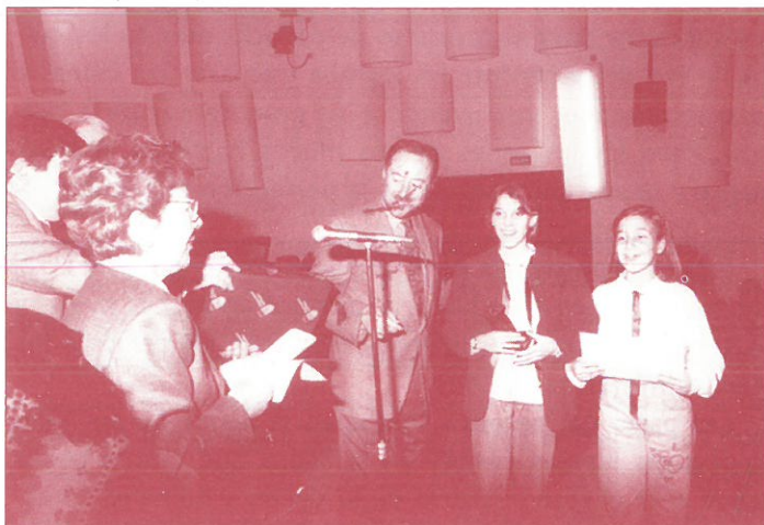
ENTREGA DEL 1.º PREMIO «VILLANCICOS» AL COLEGIO GESTA II