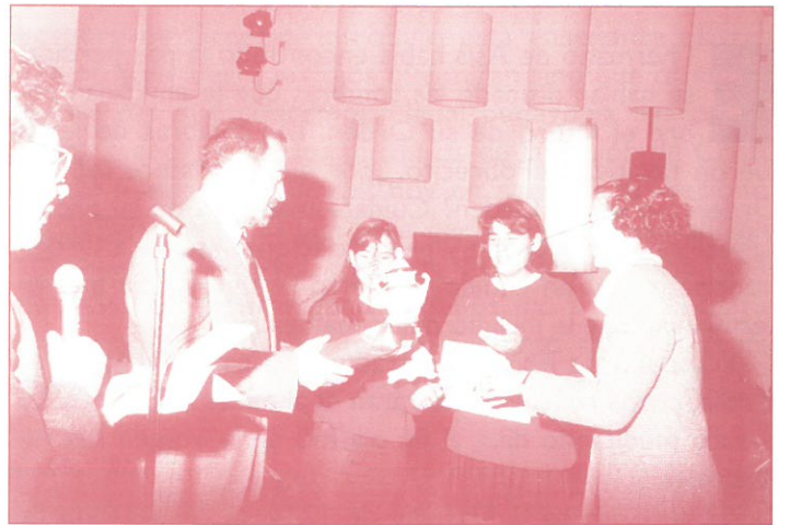
ENTREGA DEL 2.º PREMIO AL COLEGIO INMACULADA SAN ROMAN

A todos ellos también se les entregaron diplomas, lotes de libros y trofeos a los ganadores.