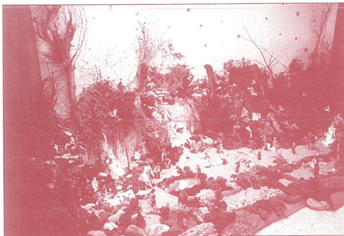
BELEN DEL COLEGIO INMACULADA