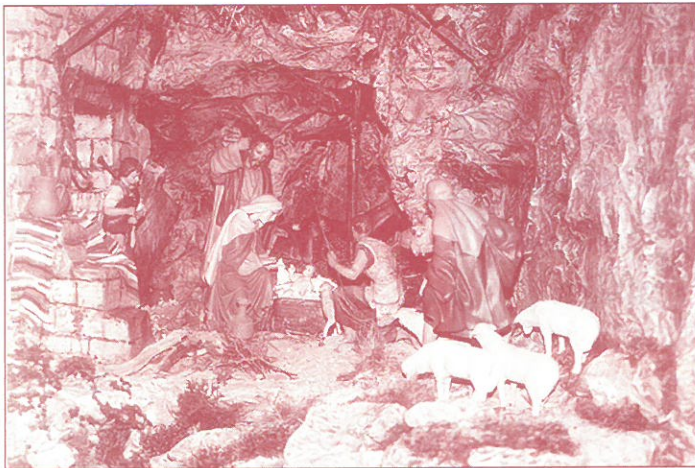
DETALLE DEL BELEN DE LA IGLESIA DE LOS P.P. CARMELITAS