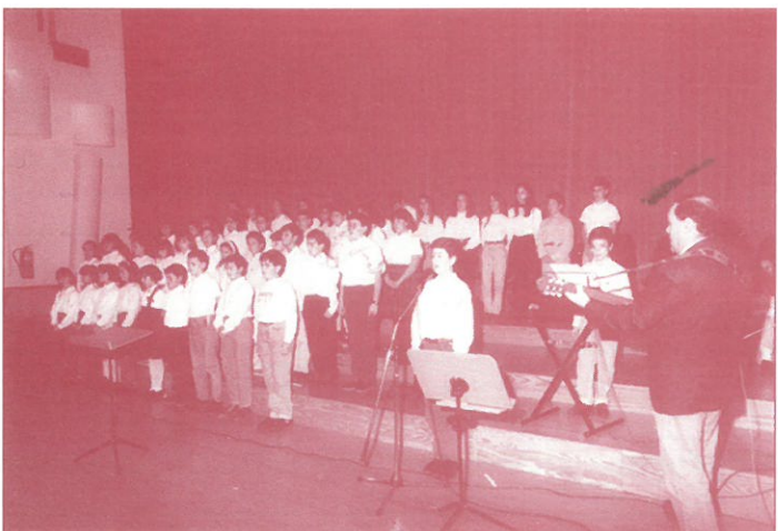
CORO DEL COLEGIO NACIONAL PARQUE INFANTIL. 3.º PREMIO VILLANCICOS